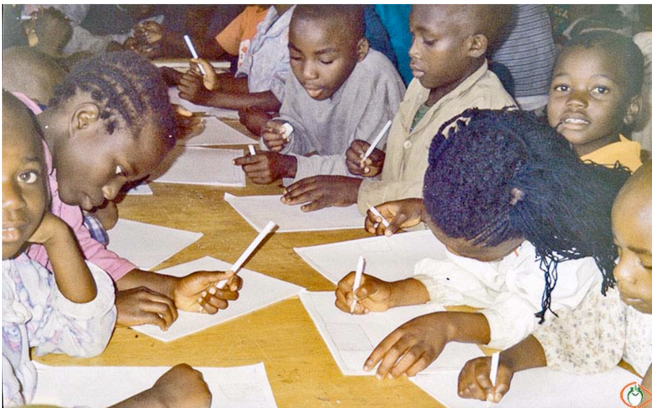
Les enfants se concentrent pendant la formation au dessin au Centre Virunga de Children's Voice en avril 2007